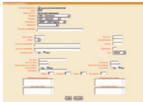
Copie d'écran Extranet : saisie d'une manifestation

La date limite de dépôt des candidatures est fixée au 1 er mars 2005. L'ensemble de ces procédures sont reprises dans le Guide Club 2005. Un mode d'emploi de la saisie des manifestations sur Extranet a été diffusé dans le Guide Club 2005 (page 139).