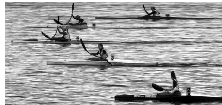
Photo finish K1 dames, la déformation est due au logiciel de chronométrage

Félicitations aux athlètes et merci à tous ceux qui ont participé à l'organisation.